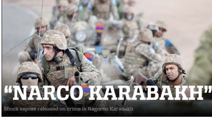
Shock expose released on erime in Nagorno Karabakh