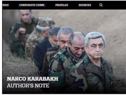
NARKO KARABAKH AUTHOR'S NOTE

Böyük britaniyalı jurnalist yazır ki, Dağlıq Qarabağda narkotiklərin yetişdirilməsi, emalı və dövriyyəsi sayəsində Ermənistan hazırda böyük maliyyə gəlirləri əldə edir. Bu çirkli pullar, ilk növbədə, Dağlıq Qarabağda xunta rejiminin, eləcə də buradakı hərbi qruplaşmaların saxlanılmasına və yeni, modern silahların alınmasına sərf olunur. Dağlıq Qarabağın əsas